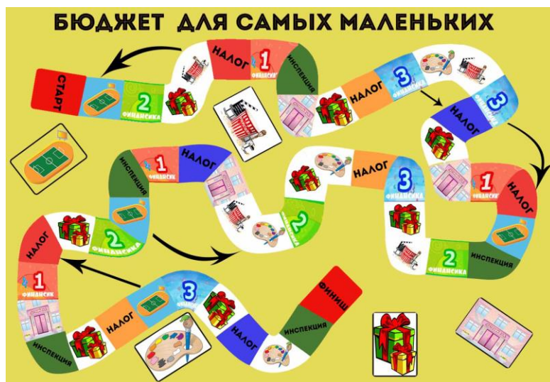
Рисунок 7 – Игровое поле настольной игры «Бюджет для самых маленьких»

Для учащихся дошкольных образовательных учреждений сотрудниками финансового отдела разработана настольная игра «Бюджет для самых маленьких» (рисунок 7).