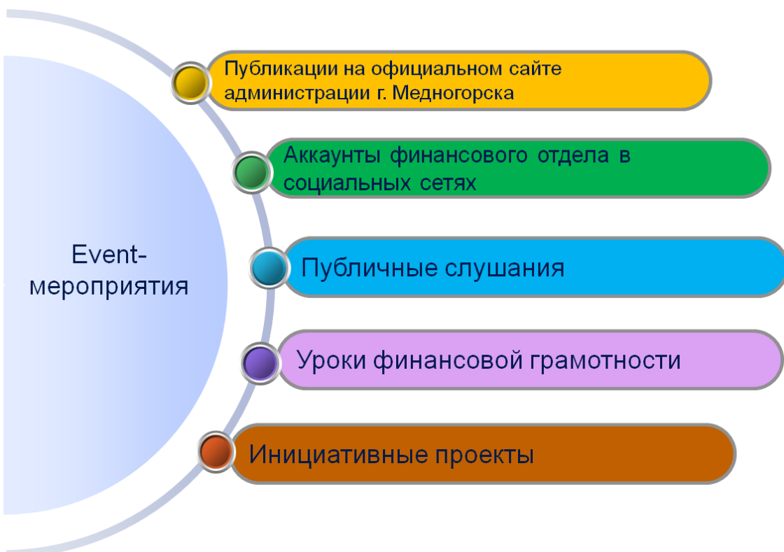
Рисунок 1 - Event-мероприятия, проводимые в городе Медногорске

В муниципальном образовании город Медногорск ведется комплексная работа по повышению финансовой грамотности граждан всех возрастных категорий (рисунок 1)