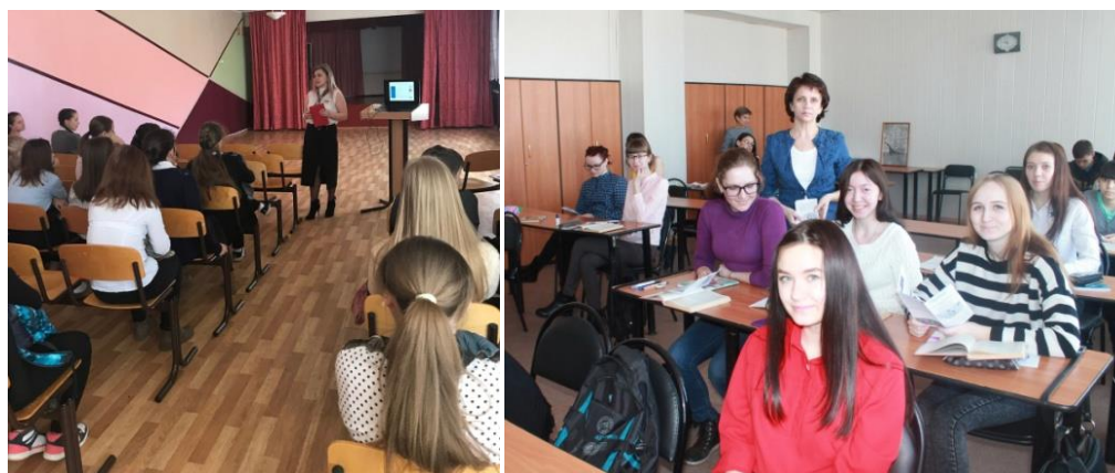
Рисунок 6 – Уроки финансовой грамотности в МБОУ «Средняя общеобразовательная школа №2 г.Медногорска», ГАПОУ «Медногорский индустриальный колледж»

Регулярно сотрудники финансового отдела проводят уроки финансовой грамотности в образовательных учреждениях города (рисунок 6). В ходе занятий учащиеся знакомятся с такими темами как «Управление собственными финансами», «Бюджет и бюджетная система России», «Бюджет: сколько я плачу и что получаю?», «Мошенничество. Защити себя сам» и т.п., задают вопросы, решают задачи.