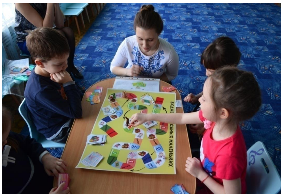
Рисунок 8 – Урок финансовой грамотности в МБДОУ «Детский сад №14 «Буратино»

Суть настольной игры «Бюджет для самых маленьких» - не только в развлечении, но и в развитии экономических навыков ребенка. Ребенок получает представления о понятиях «бюджет», «расходы», «доходы», «налог», приобретает понимание о финансовой роли государства (рисунок 8). Игра предусматривает уплату налогов, участие в культурной жизни общества, получение дохода. Все это существенно расширяет представление ребенка об окружающем его экономическом мире, которое потом уже будет развиваться в школе, в колледже и в университете.