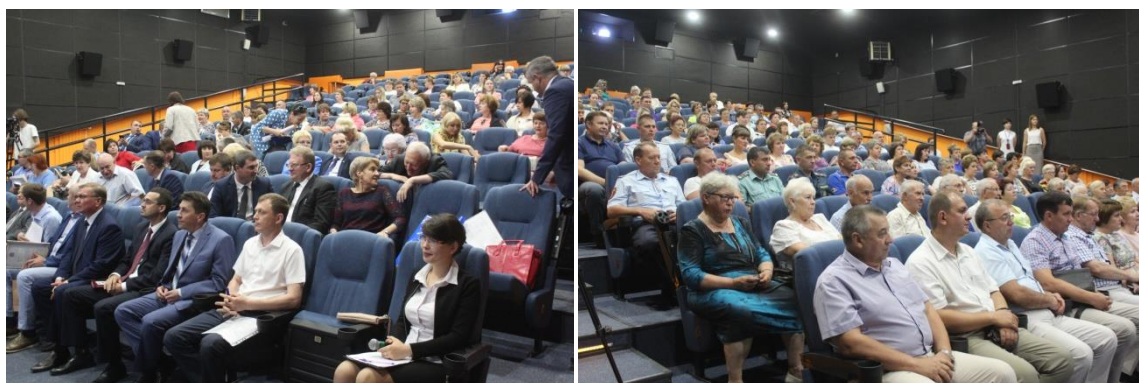
Рисунок 5 – Публичные слушания в г. Медногорске

Два раза в год проводятся публичные слушания по рассмотрению проектов решения Медногорского городского Совета депутатов «Об утверждении бюджета муниципального образования город Медногорск», «Об исполнении бюджета муниципального образования город Медногорск» (рисунок 5). Для участия в публичных слушаниях приглашаются жители города, представители предприятий, организаций и общественных объединений города Медногорска. С проектами решений можно ознакомиться в газете «Медногорский рабочий», на сайте администрации, в центральной городской библиотеке.