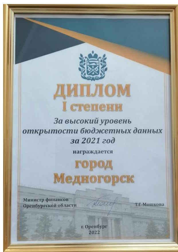
Рисунок 4 – Диплом I за высокий уровень открытости бюджетных данных

Кроме того, по опубликованным данным журнала «Бюджет» Медногорск находится в тройке лидеров в Рейтинге медийной открытости муниципальных образований за 2021 год