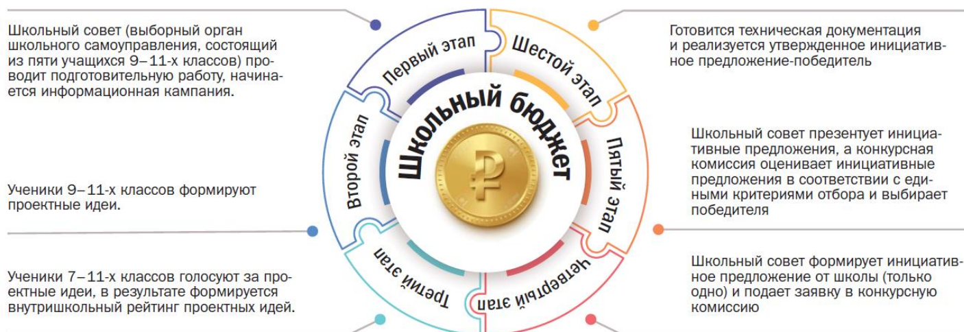
Рисунок 9 – Этапы проекта «Школьный бюджет»

В этом году проект «Школьный бюджет» состоял из шести этапов (рисунок 9)